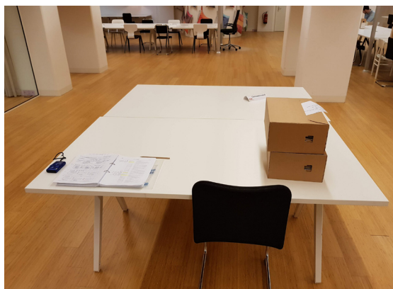
Een close-up van een werkplek in de studiezaal van het Nationaal Archief.

Sinds najaar 2016 is het gemeentehuis van Woerden in renovatie. Ook het RHC was gehuisvest in dit gemeentehuis, waar wij eerdere jaren met plezier kwamen. Sinds de renovatie is het RHC (tijdelijk) gehuisvest in Oudewater. Wij zijn zoals velen weten een grootverbruiker als het gaat om de aantallen te onderzoeken dossiers. In Oudewater konden wij maar 5 tot 8 dossiers aanvragen, wat voor ons dus niet effectief en rendabel zou zijn. Daarom wachten wij af totdat het RHC weer zijn deuren opent in Woerden. Zodat wij vermoedelijk pas in het najaar van 2019 kunnen beginnen met het onderzoeken van de waterschapsarchieven van het Hoogheem-