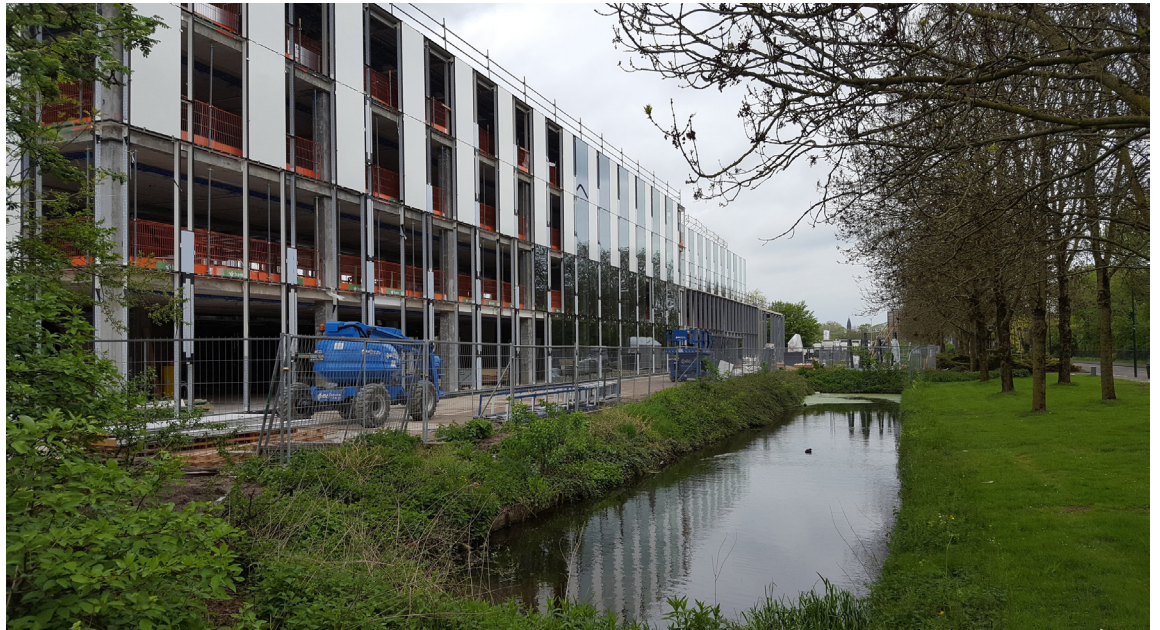
Zaterdag 28 april 2018 ging SHH kijken naar de vorderingen van de renovatie van het gemeentehuis van Woerden.

Honswijk'. Het onderzoek richtte zich vooral op het veranderende landschap rondom de forten en werken van Honswijk, in Tull en 't Waal en Schalkwijk. Hoe werden de wegen en watergangen omgelegd bij veranderingen? Ook ging onze belangstelling uit naar de veranderingen in de percelering in het landschap bij het wijzigen of bouwen van forten, In tegenstelling tot andere historische onderzoeken die zich richt(t)en op de bescherming of afweer van forten, was dat ons doel niet.